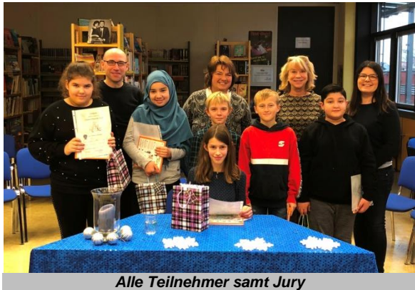
Alle Teilnehmer samt Jury

Der bundesweite Vorlesewettbewerb wird 60 Jahre alt! Und wie jedes Jahr waren wieder alle Schülerinnen und Schüler der 6. Klassen zum Lesewettstreit eingeladen.