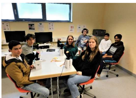
Das Team Moderation und Technik bei der Arbeit am Podcast