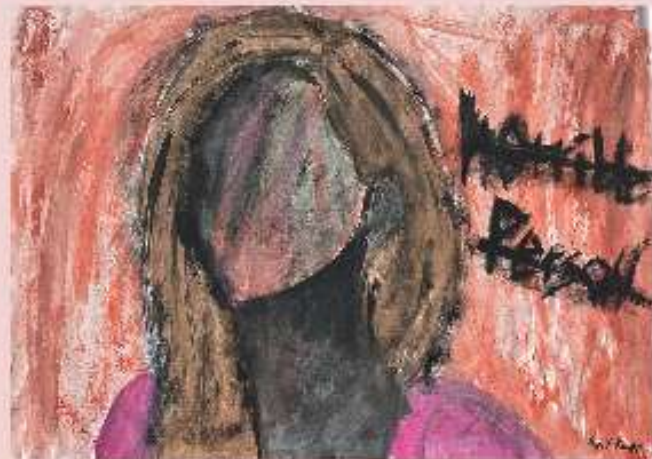
„the horrible person“