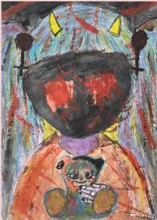
„wann sehe ich wieder Farben“?